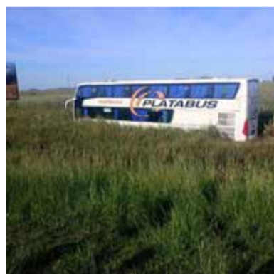
El micro terminó a un costado del camino tras despistar.

En el lugar del siniestro trabajaron equipos de Aubasa, Defensa Civil, ambulancias del Hospital