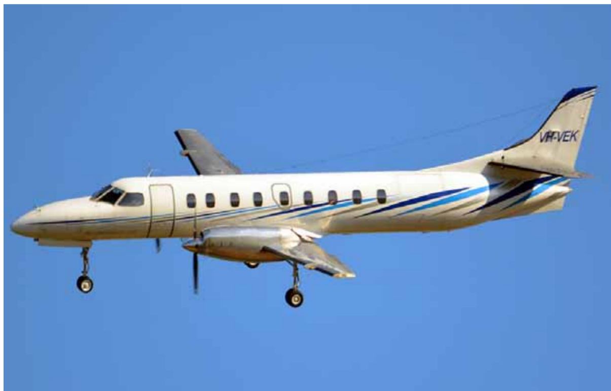
La firma Humming Airways SRL detalló que para esa conexión se utilizarían naves tipo Fairchild Swearingen Metroliner 4.

Lo anunció el ministro durante su participación en el coloquio IDEA, en Mar del Plata. Desde la empresa que haría la conexión, sin embargo, adelantaron que aún no hay fecha confirmada.