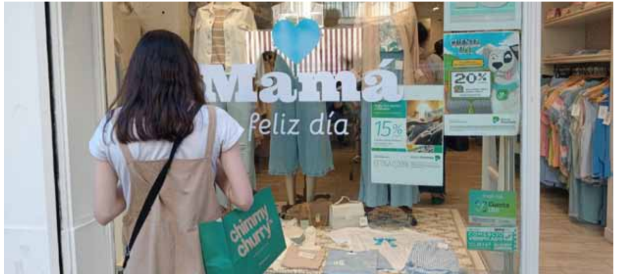
El rubro indumentaria marcó una recuperación respecto a la caída que ha sufrido a lo largo del año.

Sin dejar de considerar la comparación anual, fue una fecha con actividad moderada. El ticket de ventas tuvo un promedio de $33.819, reflejando la inclinación de las familias por regalos económicos. Libros e indumentaria de