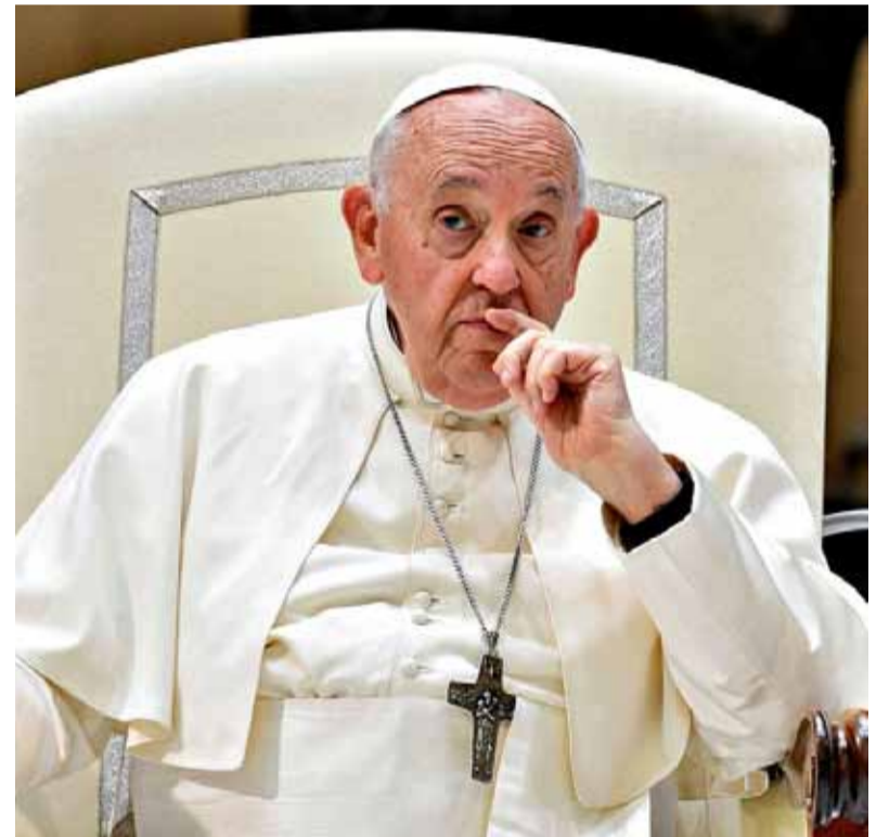
Francisco habló de una "martirizada" Palestina y pidió el fin de las guerras.

Asimismo, se produjo un ataque aéreo israelí contra una zona residencial en el área de Beit Lahia, en el norte de la Franja de Gaza.