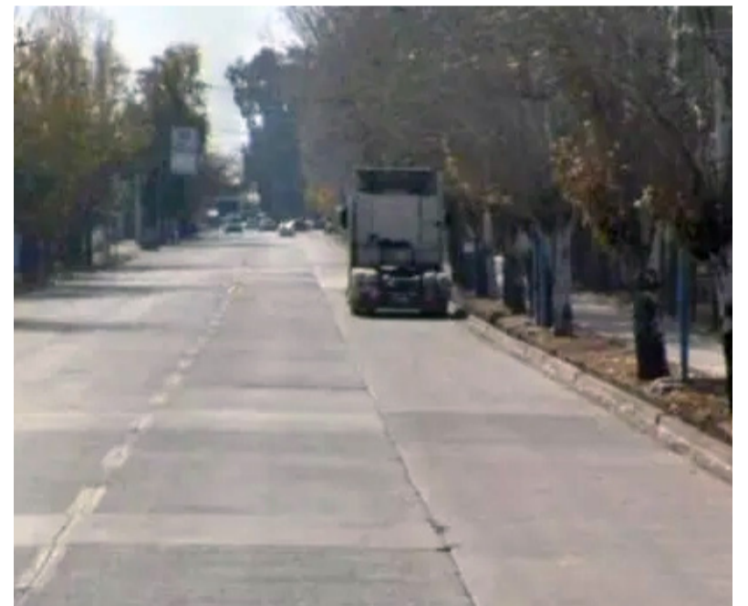
La zona donde encontraron a una mujer desnuda y con una pierna apuntada.

Una de las principales teorías que manejaron los investigadores fue que el hombre la atropelló y luego la abandonó, aunque aún trabajan para determinar si se trató de un accidente o de un acto premeditado.