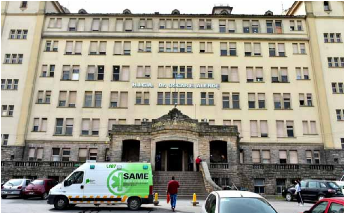
El Hospital Interzonal General de Agudos (HIGA) de Mar del Plata.

El episodio, cuyas causas no se determinaron, ocurrió durante la madrugada de ayer domingo.